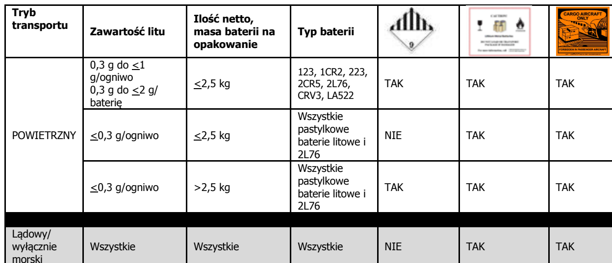
Tabela podsumowująca etykietę

Poniżej zamieszczono tabelę globalnej etykiety dotyczącej litu podsumowującą obowiązujące globalnie wymagania dotyczące oznakowania.