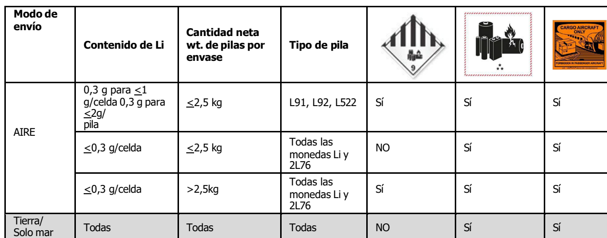
Gráfico de resumen de etiquetas

A continuación se proporciona un cuadro de etiquetas de litio global para resumir los requisitos de etiquetado globales actuales.